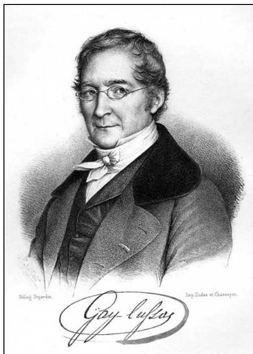
Loís Josèp de Gay-Lussac (1778-1850) Quimista lemosin