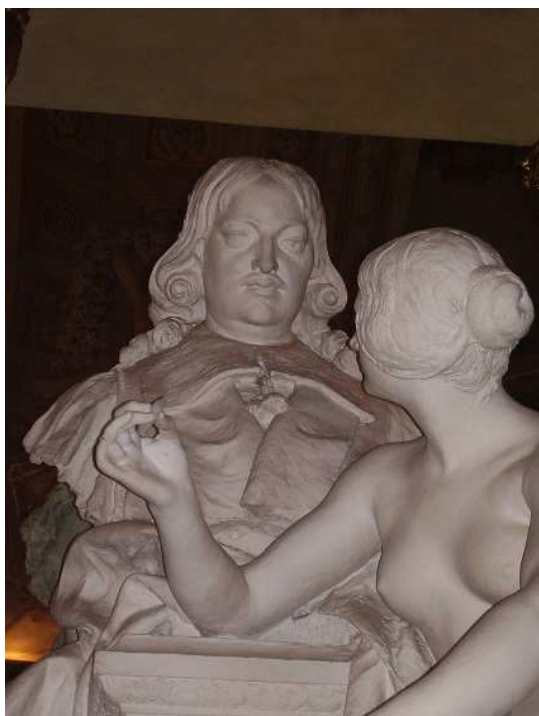
Pèire de Fermat (1601-1665) Matematician gascon

Lo luòc de naissença de mantunei de nòstrei sabents èra sovent una masada reculada, e fins qu'au sègle 19, èran dins un environament occitanoparlant. Un exemple de mai que s'opausa a la vision maniquèa d'un abat Grégoire qu'assajava de far passar l'idèa que « a la vila lo francés e en consequéncia l'intelligéncia ; a la campanha, lo patés e l'arrieracion mentala ». D'uneis sabents (qu'escriguèron sei tèxtes scientifics en latin o en francés, ailàs pas en ocitan) escriguèron pasmens a costat de dictionaris, de peças de teatre, de poesias en occitan. Leis Occitans se son illustrats particularament en astronomia, tecnologia dei ponts e dei motors, aeronautica, e quimia.